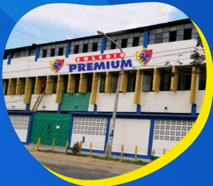
Calle los Brillantes Mz. A Lt. 5 Urb. Miraflores - Piura