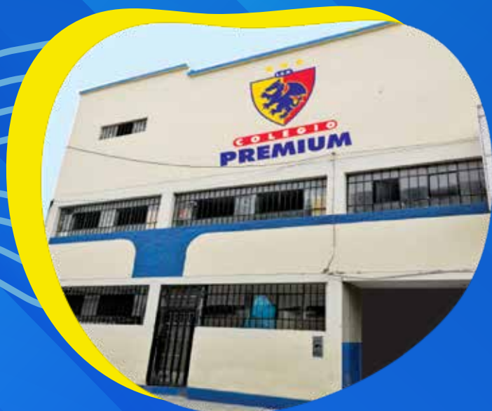
Calle Arequipa N° 327- Piura