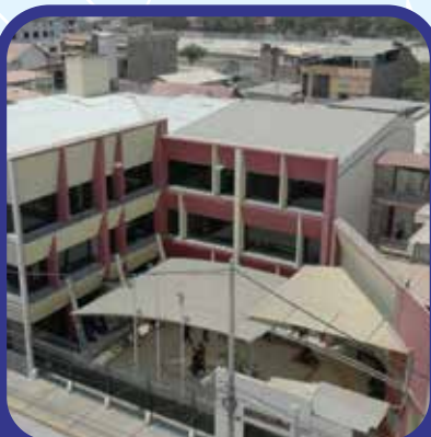
Calle Libertad 735 - Piura.