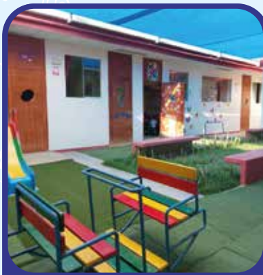
Nivel Inicial Calle Lima 746 - Piura.