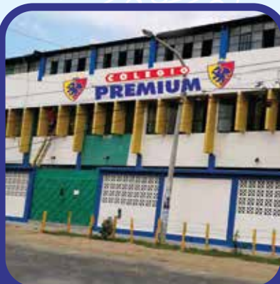
Calle los Brillantes Mza. A Lt. 5 Urb. Miraflores - Castilla.