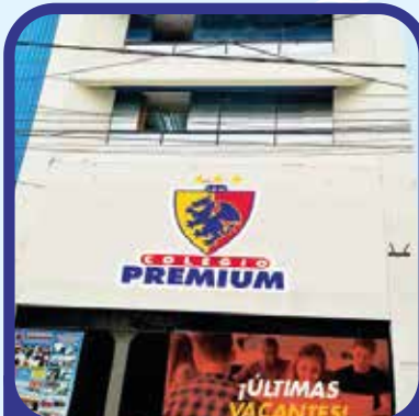
Oficina Principal Jr. Cuzco 323 - Piura.